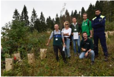
Una delegazione dell'Associazione Italiana Scatolifici, insieme a FSC Italia, in visita sul monte Mosciagh dove è stata piantata la nuova foresta

Sono passati 3 anni dalla tempesta Vaia, un fenomeno atmosferico di rara intensità che a fine ottobre del 2018 ha sconvolto la fisionomia di numerosi territori montani di Veneto, Friuli, Trentino-Alto Adige e Lombardia.