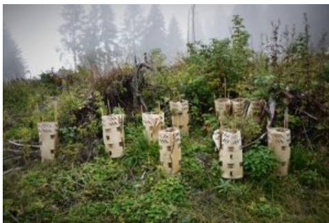
La protezione delle piantine più fragili è in cartone, materiale rispettoso dell'ambiente

Foresta dell'Associazione Italiana Scatolifici, un bellissimo progetto di sostenibilità ambientale condiviso tra tutti gli scatolifici associati che ha raggiunto rapidamente i 660 alberi.